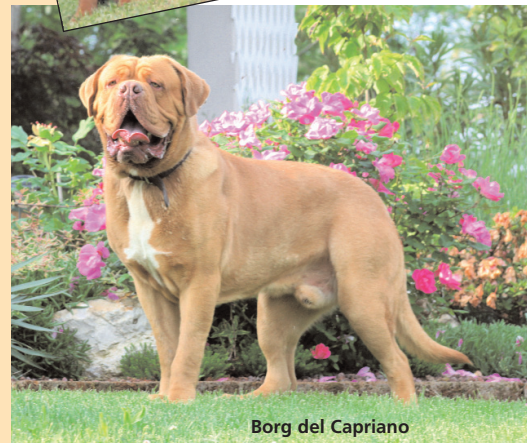
Borg del Capriano